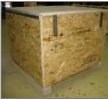
Kiste aus OSB