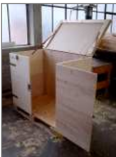
Kiste zum Klappen